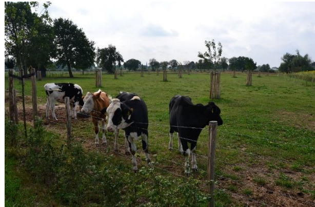
Inrichtingsprojecten omgeving Panoven (aangelegd in 2018-2019)