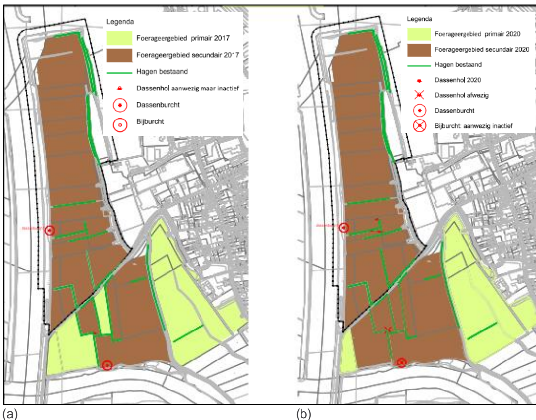
Figuur 4.1 Situering dassenleefgebied ter hoogte van uitbreiding Haven Heijen in 2017 (a) en 2020 (b).

Opvallend tijdens de onderzoeken in 2017 en 2020, is de duidelijke oriëntatie van de das vanuit de hoofd-/kraamburcht op het grasperceel ten zuidwesten van het plangebied. Deze wordt frequent bezocht via de natuurvriendelijke oever en aanwezige haagstructuren. Dit blijkt onder andere uit de intensiviteit van de belopen dassenwissels tussen de burcht en aangetroffen sporen op het betreffende grasperceel. Dit in tegenstelling tot de nauwelijks aangetroffen dassensporen in noordelijke richting vanuit de hoofd-/kraamburcht. Dit is waarschijnlijk te verklaren, doordat de aanwezige percelen binnen het plangebied vrijwel volledig uit secundair leefgebied bestaan in de vorm van maisakkers en geleidende haagstructuren in noordelijke richting vanuit de hoofd-/kraamburcht vrijwel ontbreken. Een schraal contrast met het jaarrond beschikbare stapelvoer op het grasperceel ten zuiden van het plangebied. De aanwezige haagstructuur langs het zandpad in het noordoostelijke deel van het plangebied biedt periodiek nog aanvullend voedsel.