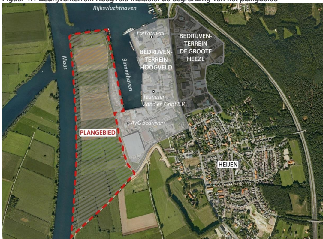
Figuur 1.1 Bedrijventerrein Hoogveld inclusief de begrenzing van het plangebied

Gelet op de toenemende vraag naar watergebonden bedrijventerrein (per schip te bereiken) met bijbehorende overslagmogelijkheden bestaat er bij AVG en Teunesen (verder te noemen de initiatiefnemers) behoefte aan uitbreiding van Haven Heijen c.q. een nieuw bedrijventerrein voor watergebonden bedrijvigheid (zie het plangebied in figuur 1.1).