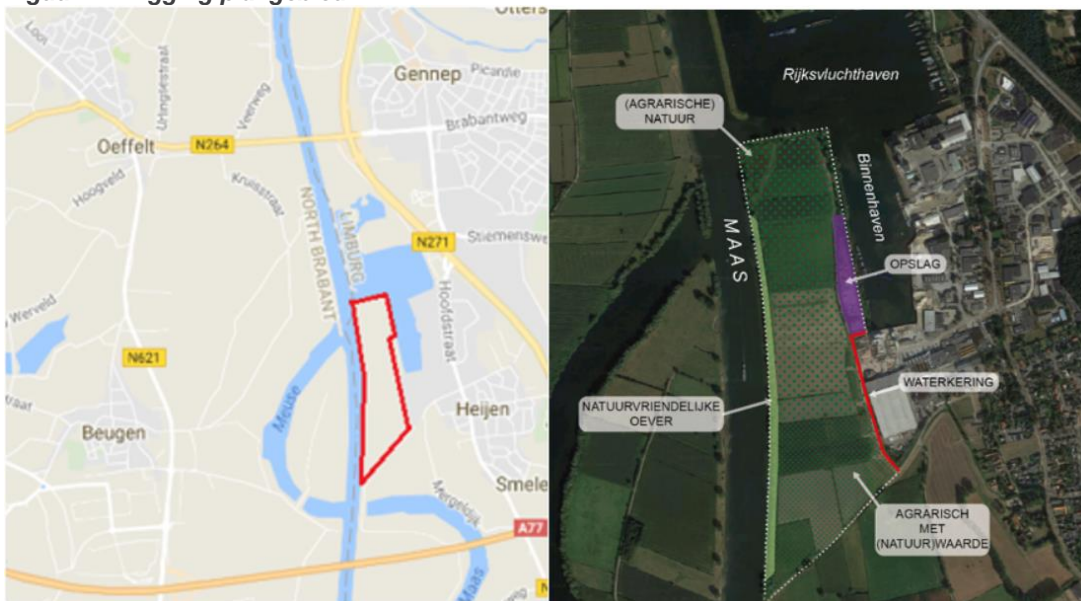
Figuur 2.1 Ligging plangebied

Het plangebied is in de huidige situatie grotendeels in gebruik voor landbouwkundige doeleinden (akkerbouw). Het noordelijk gebied is in het bestemmingsplan (zie figuur 1.2) bestemd als natuur. Ook is sprake van de functieaanduiding ‘specifieke vorm van natuur – ontgrondingen’ voor het hele plangebied met de bestemming ‘Natuur’. Het zuidelijk gedeelte heeft een agrarische bestemming. Een beperkt deel van het plangebied (vrijwel direct grenzend aan de bestaande haven) is door AVG in gebruik als opslagterrein. Dit deel van het plangebied, onderdeel van het bestaande bedrijventerrein Hoogveld, heeft al de bestemming bedrijventerrein. De oevers zijn aan deze zijde van de industriehaven onverhard. Aan de westzijde heeft Rijkswaterstaat een natuurvriendelijke oever langs de Maas aangebracht. Hier komt opgaande begroeiing voor. Verder staan er verspreid in het plangebied enkele lijnvormige bosschages. Aan de noordkant van de binnenhaven ligt een Rijksvluchthaven, met langs de oostelijke oever circa 17 woonboten. Het plangebied grenst aan de zuidoostzijde aan de primaire waterkering. Hier ligt ook de half verharde toegangsweg ‘de Witte Steen’.