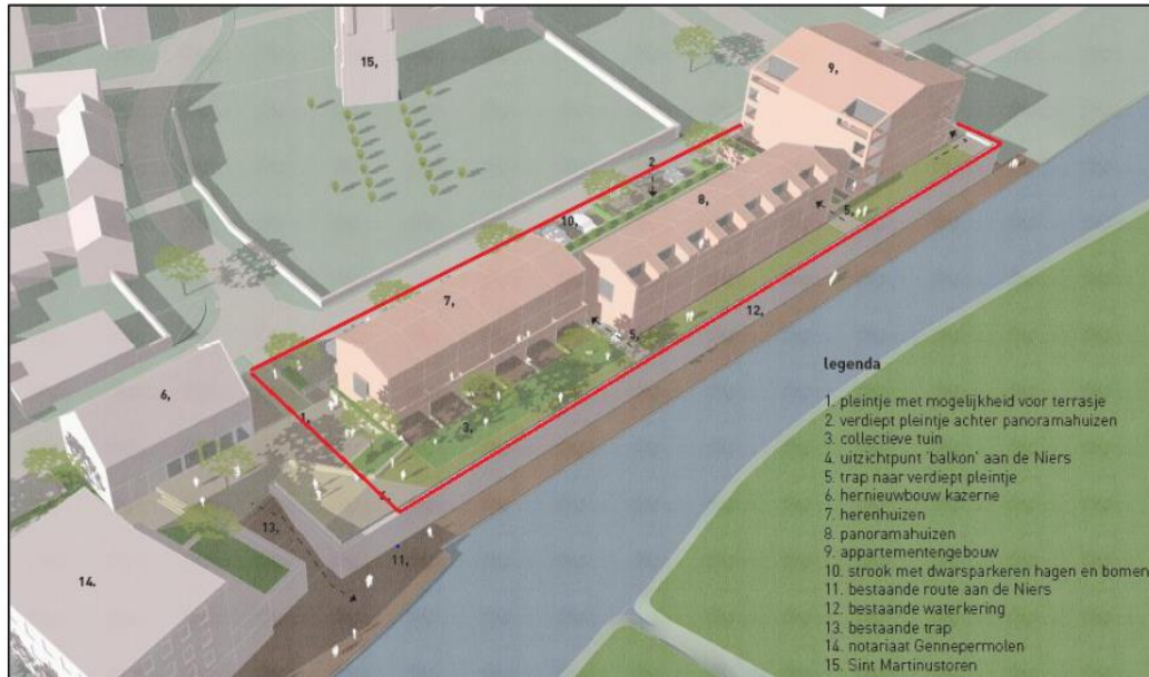
Situatieschets aanzicht beoogd planvoornemen