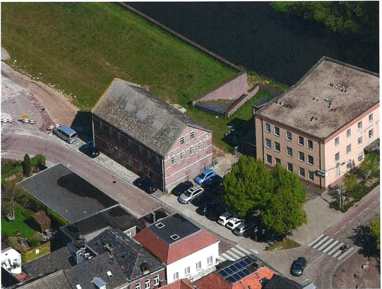
Locatie Gennepmolen en her te ontwikkelen pand Gennephuisweg