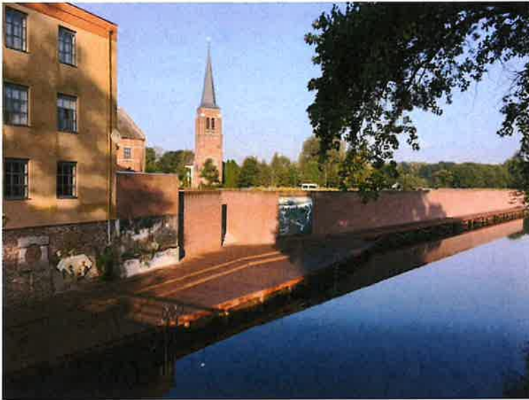
Ontwikkellocatie Gennepmolen gezien vanaf de Niersbrug