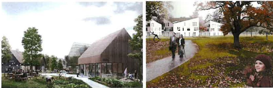
Speciale woonvormen of andere kansen in de toekomst