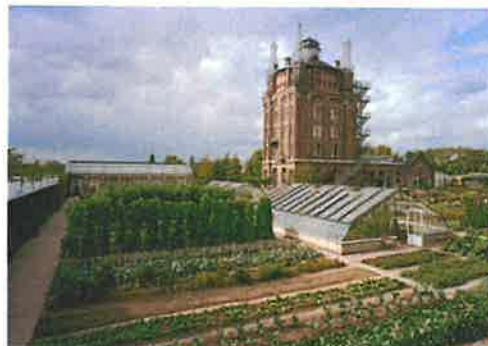
Villa Augustus Dordrecht