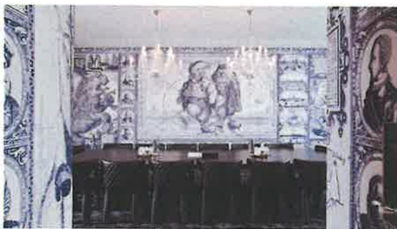
Ceramik in een nieuw jasje