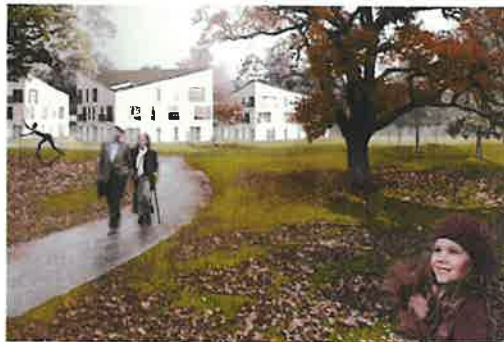
Speciale woonvormen of andere kansen in de toekomst