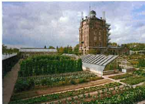
Villa Augustus Dordrecht