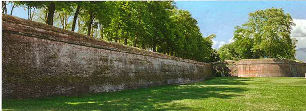
Lucca, Italië, de ommuurde oude stad, als inspiratie