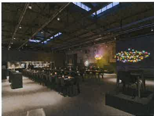
Herbestemming voor horecavoorziening