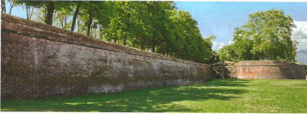
Lucca, Italië, de ommuurde oude stad, als inspiratie