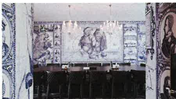
Ceramik in een nieuw jasje