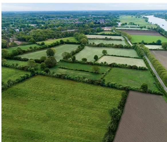
Visualisatie van een hersteld Maasheggengebied (streefbeeld)

Inmiddels zijn we ruim een jaar verder, tijd voor een update over stand van zaken op een aantal aspecten. Er is hard gewerkt aan het opzetten van de projectorganisatie en allerlei noodzakelijke voorbereidingen en studies.