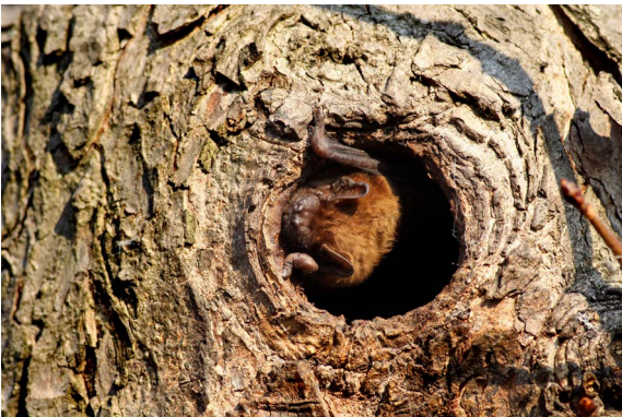
Vleermuizenverblijf in de boomholten of onder de boomschors

Tijdens het broedseizoen (15 maart tot 15 juli) mag u in veel gevallen geen bomen kappen of struiken snoeien.