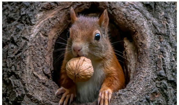
Een eekhoorn in de boom