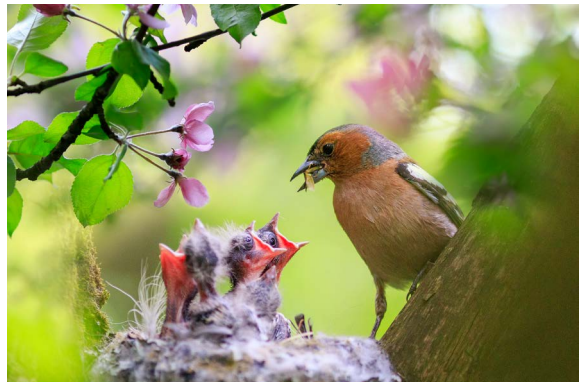
Een vogelnest in de boom