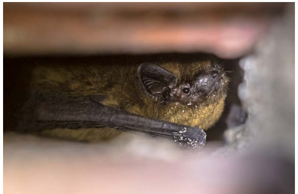
Bepaalde soorten vogels en vleermuizen verblijven in spouwmuren, tussen binnen- en buitenmuur

Verschillende soorten vleermuizen en vogels verblijven in spouwmuren of in daken. Bij het na-isoleren van een spouwmuur wordt de open ruimte tussen binnen- en buitenmuur, opgevuld met isolatiemateriaal. Bij na-isolatie van de spouw kunnen op dat moment aanwezige dieren levend worden begraven of ingesloten, of raken verkleefd door lijmstoffen. De verblijfplaatsen zelf gaan (op grote schaal) verloren. Hetzelfde geldt voor dakisolatie waarbij het gehele jaar door beschermde nesten van gierzwaluwen, huiszwaluwen en huismussen en de verblijfplaatsen van diverse vleermuissoorten kunnen worden verstoord of zelfs geheel vernietigd.