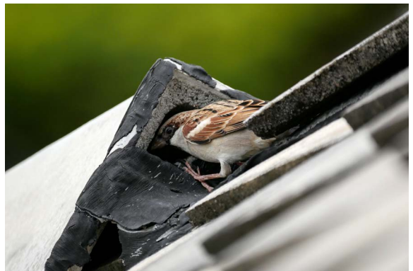
Bepaalde soorten vogels en vleermuizen verblijven in daken, tussen de dakpannen en de dakbetimmering.