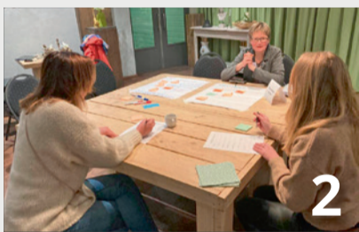
Verder bouwen aan OMO