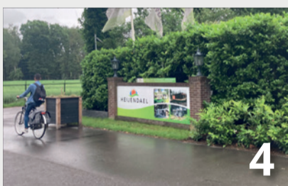
Opvang vluchtelingen in Gennepe