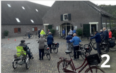
Lekker doortrappen in Gennepe