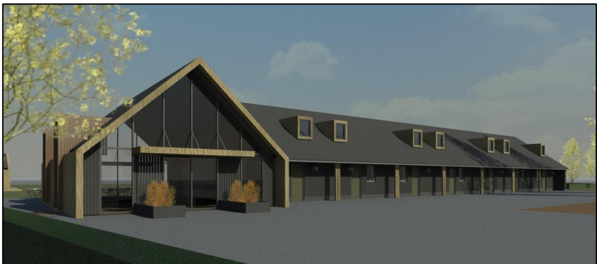
Impressie te bouwen recreatie-appartementen met groepsaccommodatie