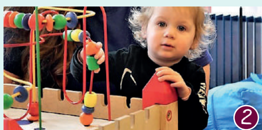
Van harte welkom in het OuderCafé!