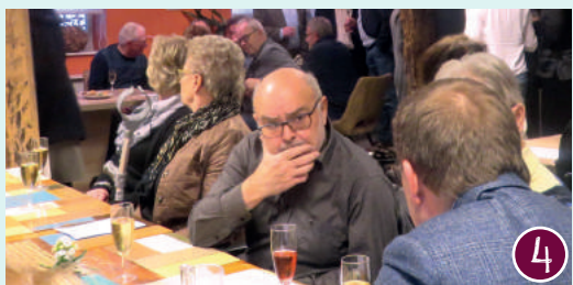
Nieuwe huiskamer Ottersum

Z Dit is een uitgave van gemeente Gennepe. De OMO-krant verschijnt enkele keren per jaar en wordt huis-aan-huis bezorgd.