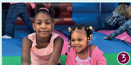
Pop-up ideeënhuis Gennepe-Zuid