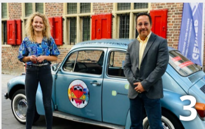
De KonnectKever • Gennepe in verbinding!