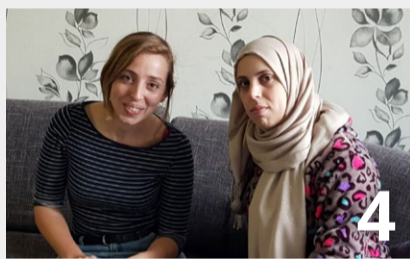
Taalmaatjes • Op een natuurlijke manier oefenen met de Nederlandse taal