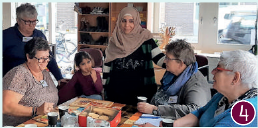
Ontmoeten en ontvangen in Gennepe-West

Z Dit is een uitgave van gemeente Gennepe. De OMO-krant verschijnt enkele keren per jaar en wordt huis-aan-huis bezorgd.