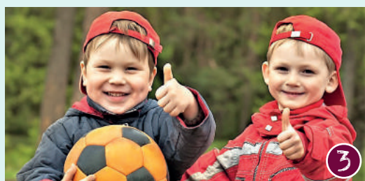
Te weinig geld voor sportclub of muziekles?