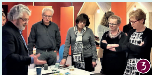
Samen verder in Gennepe