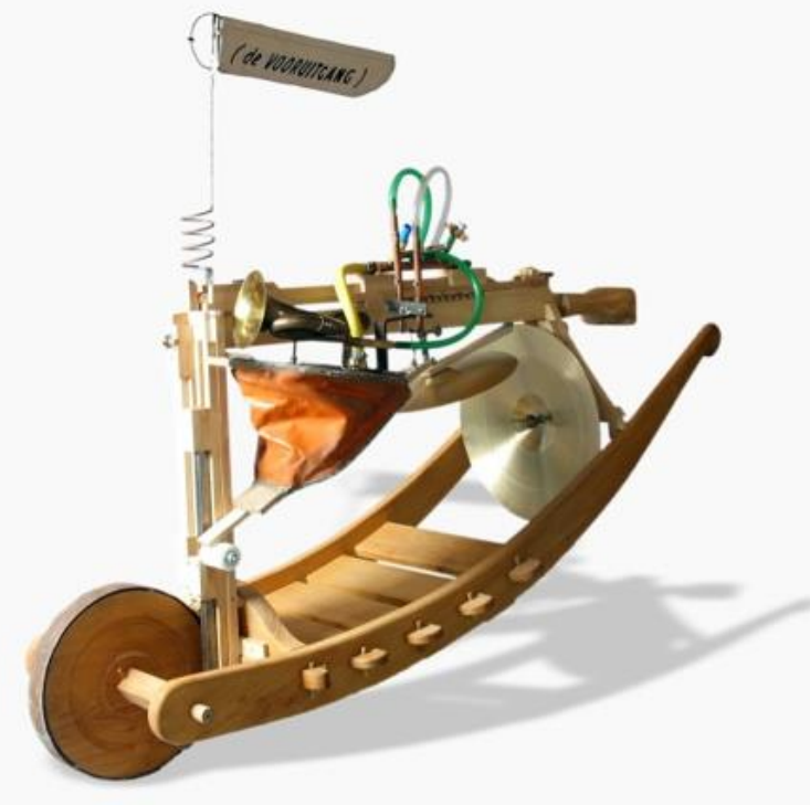
DE VOORUITGANG [Jaap Glandorff, 2011]

De gemeente Gennep is van oudsher een plek waar creatieve geesten zich op hun gemak voelen. Het is ook niet voor niets dat Gennep rijk is aan kunstenaars van zeer uiteenlopende aard. We zijn daar als gemeente trots op, immers: kunst zet mensen aan het denken, geeft nieuwe waarde en oriëntaties en stimuleert mensen in hun eigen creativiteit 0 . Kunstenaars zijn de cultuurmakers en zijn van groot belang in de cultuursector en brengen sprankelende en verrassende initiatieven voort.